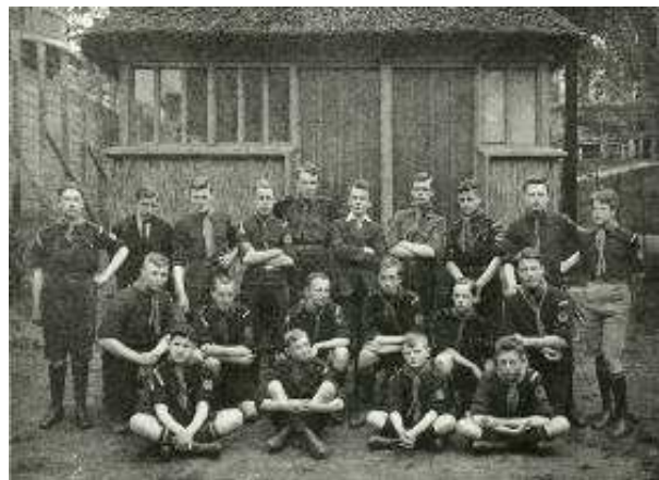
De blokhut 5-1-1924.