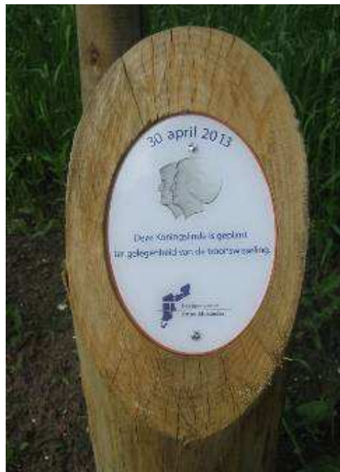
Gedenkplakette bij de koningslinde in het Ommoordseveld. Tekst: "30 april 2013. Deze koningslinde is geplant ter gelegenheid van de troonwisseling. Deelgemeente Prins Alexander"

In den lande zijn vele oude en nieuwe koningslinden te bewonderen, onder andere in Den Haag. Daar heeft kroonprins Willem-Alexander op 23 april 2013 een koningslinde geplant in het wijkpark Transvaal met de hulp van leerlingen van groep 6 van de Comeniusschool. In Amerongen, gemeente Utrechtse Heuvelrug, nabij de Andrieskerk staat de Wilhelminaboom, geplant ten tijde van de troonsaanvaarding van prinses Wilhelmina in 1898. Via internet zijn vele Wilhelmina-, Juliana- en/of Beatrix-bomen en nu ook Willem-Alexander bomen te vinden.