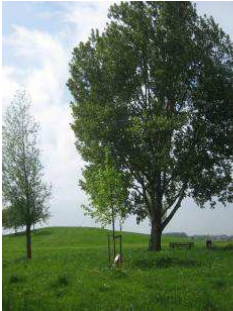
De koningslinde (midden) in het Ommoordseveld.

bomen, raakten de 'wijze' bomen in de vergetelheid. Pas na het ontstaan van het Koninkrijk der Nederlanden in 1813 begon de traditie om troonswisselingen, geboorten en huwelijken te gedenken met het planten van een duurzame boom.