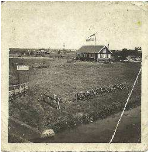
Clubhuis Cappadocië in 1934 stond aan de Kralingseweg 216.

moeilijkheden zodat men in 1928 overging naar de touwfabriek aan de 's-Gravenweg, waar men tot 1930 bleef. In 1931 hield men 'opkomst' in gebouw Onesimus, verderop aan de Kralingsche Plaslaan en vervolgens in een eigen groepshuis (2 juli 1932), dat echter al met Pasen 1933 afbrandde. Op 29 september 1934 werd het tweede groepshuis geopend. Het houten groepshuis Cappadocië (1) stond aan de Kralingseweg 216 (ter hoogte van de huidige toegang van Victoria) en zou tot 1971 dienstdoen als clubgebouw.